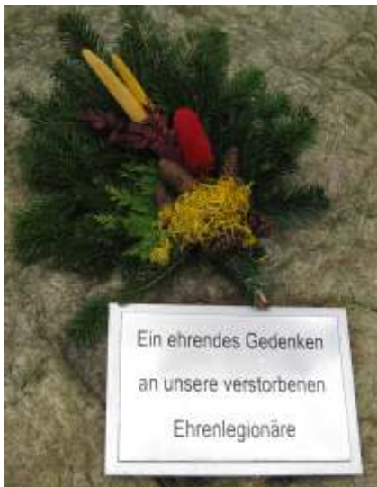
Gedenkstein am Tor 1 der Barbara-Halle

Leider hat uns auch die Nachricht erreicht, dass ein Angehöriger der Ehrenlegion verstorben ist.