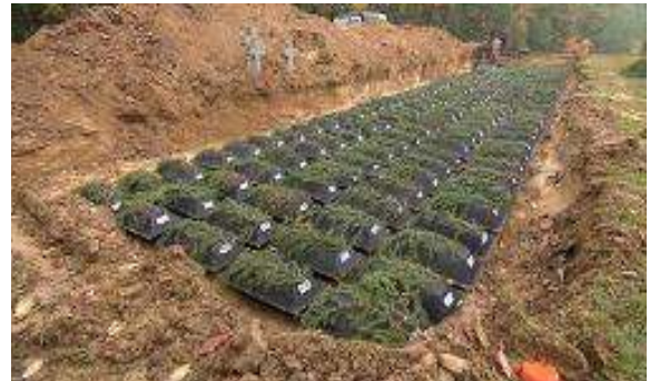
Deutschen Kriegsgräberstätte in Stare Czarnowo/ehem. Neumark/Westpommern

Unsere Barbara-Feier fand in diesem Jahr am 02. Dezember im Kamin-Zimmer des Shelter Albrecht statt.